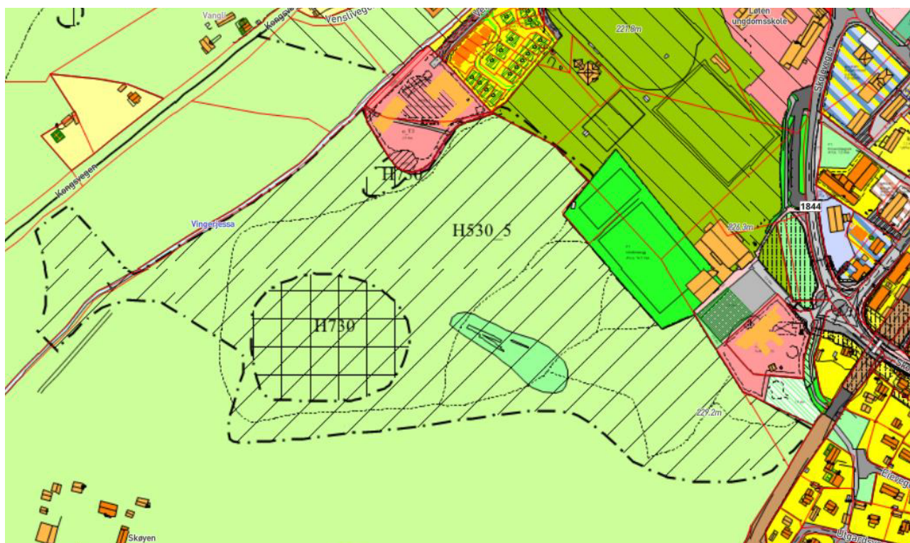
Fig 2. Utsnitt fra kommuneplanens arealdel.

Området er i kommuneplanens arealdel avsatt til landbruks-, natur- og friluftsmål (LNF) med hensynssone friluftsliv (H530_5). Det er også et par områder som omfattes av hensynssone kulturminner (H730) – se utsnitt av kommuneplanens arealdel i figur 2 nedenfor. Kulturminnene som er registrert er to lokaliteter med kullfremstillingsanlegg, og ett antatt røysfelt sentralt i området.