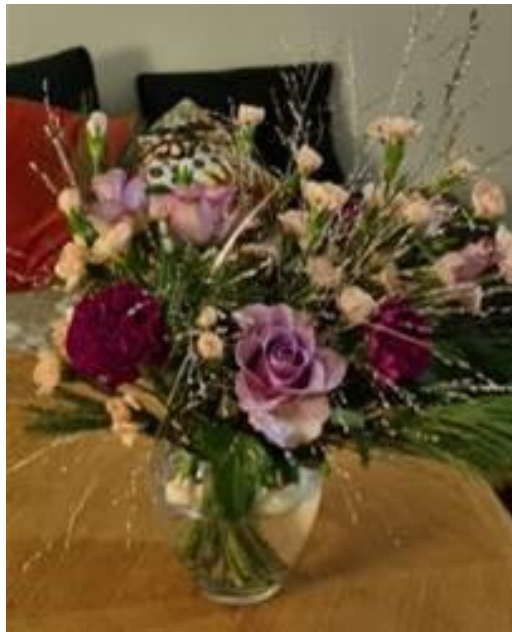
BLOMSTERHILSEN FRA EN PÅRØRENDE, SOM TAKK FOR DRØFTING AV EN OPPLEVD VANSKELIG SAK, OG OPPLEVELSE AV Å BLI SETT OG TATT PÅ ALVOR

Stange kommune har ansvar for forvaltning av midler gitt som tilskudd fra Statsforvalteren. Etikkrådets utgifter består hovedsakelig av møtehonorar og reiseutgifter for lekperson, og noe møtebevertning. For de fleste av rådets medlemmer er deltakelse en del av ordinære arbeidsoppgaver i egen kommune. To medlemmer er i turnusarbeid (Stange og Løten). Det blir lagt til rette for disse rådsmedlemmers deltakelse lokalt. Møtene er lagt til kl. 12:30 - 14:30 da vikarbehovet vil være minst.