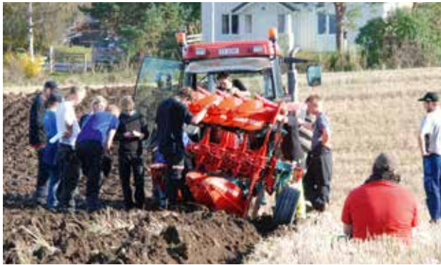
Pløyekurs: Hedmark Landbruksrådgiving har arrangert kurs og møter for unge gårdbrukere i sitt område. Pløyekurs, hvor deltakerne stiller med egen traktor og plog, har vært populære. Flere samlinger planlegges på nyåret.